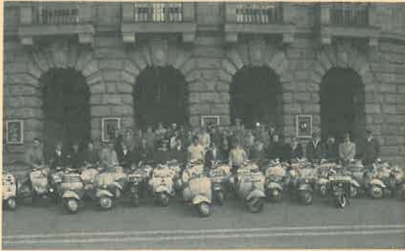
Clubausfahrt am Tag der Vespa im Jahre 1956