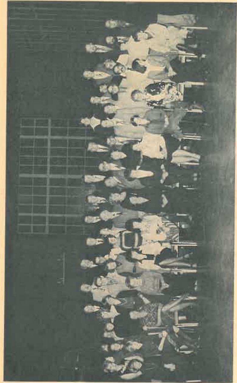
VESPA-CLUB MAINZ IM JUBILÄUMSJAHR